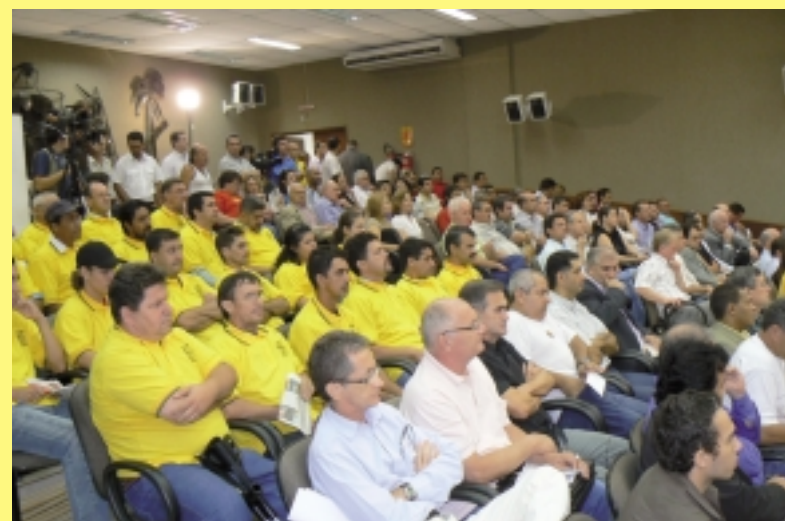
Foz do Iguaçu